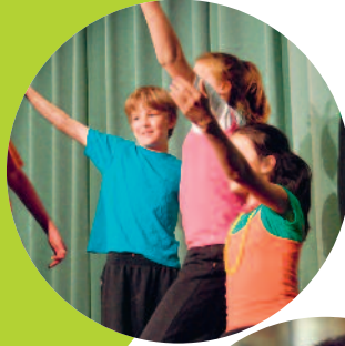
CABA KIDS Luzern Rahmenprogramm

FÜR MÜTTER, VÄTER, GROSSELTERN UND WEITERE BETREUUNGS- UND FACHPERSONEN