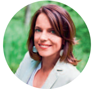
Mona Vetsch Moderation